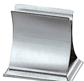
③EBM 18-8 エレガンスメニュー立て幅広