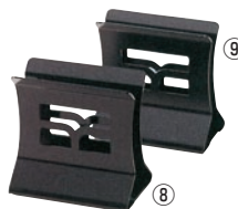
えいむ スチールブックスタンド