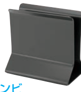
⑭シンビメニューブックスタンドブラック

●スチール素材で安定感があります。 中央部分にデザインを施した格調高い商品です。