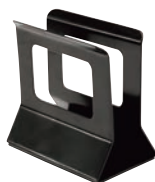
⑪シンビメニューブックスタンドブラック