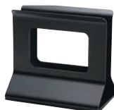
⑩シンビメニューブックスタンド