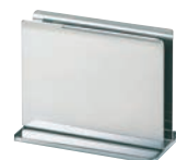
④SW 18-8 メニューブック立てTタイプ