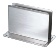
①EBM 18-8 シンプルメニュースタンド